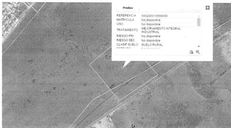
Imagen plano de usos del suelo PFU 5C/5, fuente POT

Que el predio identificado con cédula catastral No 00-02-0001-0569-000, se ubica sobre la vía Variante Mamonal Gambote en la Parcela 63 en el corregimiento de Pasacaballos del Distrito y se encuentra dentro del área indicada y delimitada gráficamente según el Plano de Usos del Suelo PFU 5/5, como actividad MIXTO 4 (M4) y se le aplicará la citada disposición. Tal como se observa en la siguiente gráfica: