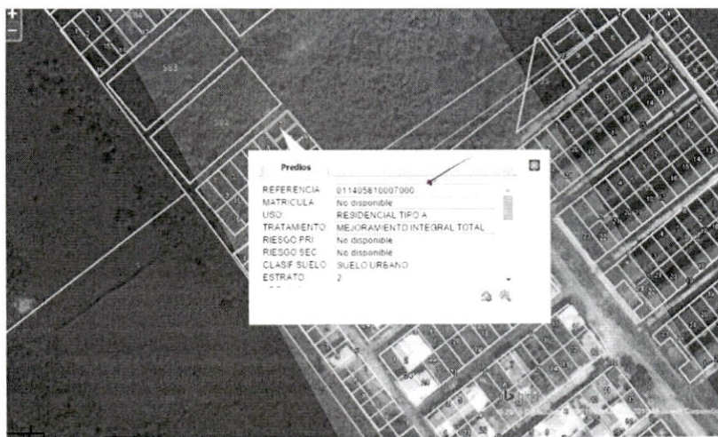
Imagen plano Usos del Suelo PFU 5B/5 -POT

Que el predio identificado con referencia catastral No 01-14-0581-0007-000 localizado en la Manzana 5 lote 5 de la Urbanización India Catalina, se ubica en el suelo urbano de la ciudad de Cartagena de acuerdo con el plano de clasificación del suelo PFG 5A/5 y según el plano de usos del suelo PFU 5B/5 como actividad RESIDENCIAL TIPO A (RA) la cual hace parte integral de la cartografía del POT, por lo tanto se encuentran en desarrollo autorizado de conformidad con la norma citada.