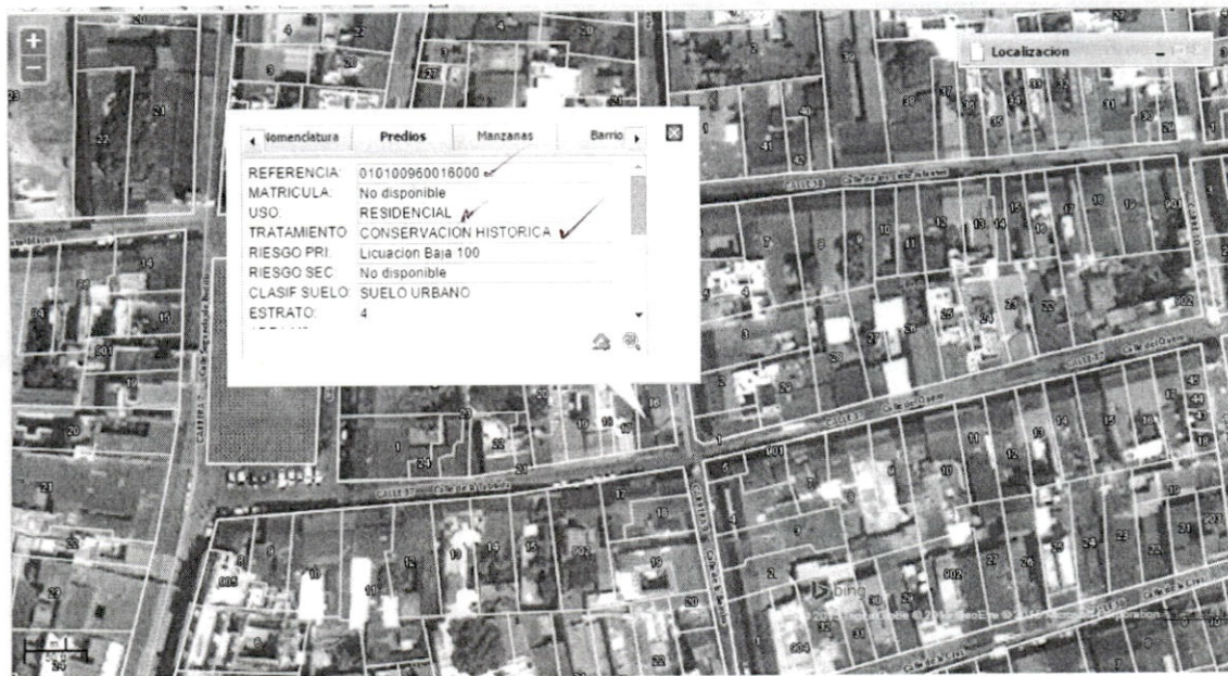
Listado de Reglamentación Predial