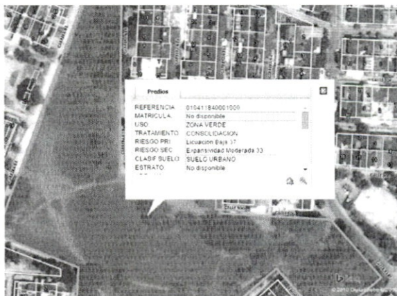
Imagen de Plano de usos de suelo PFU 5C/5

Para tal efecto, el Plan de Ordenamiento Territorial, en el numeral 3 del artículo 37 definió las áreas Susceptibles a Licuación, entre las que se cuentan: