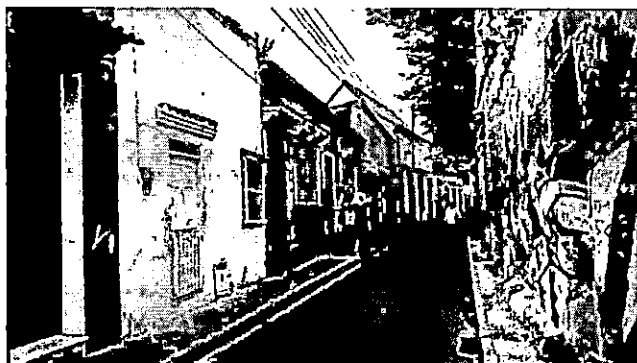
Acceso desde la calle Sierpe hacia Calle San Juan