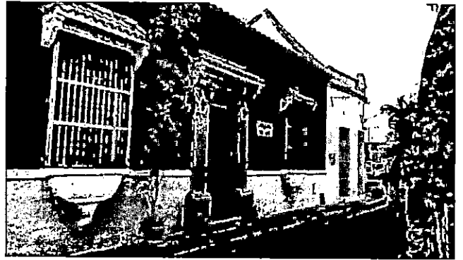
Imágenes manzana 144, Hoteles, oficinas, calle San Antonio

En el entorno del predio objeto de estudio se desarrollan actividades dedicadas a servicios de hoteles, restaurantes, oficinas, viviendas, peluquerías.