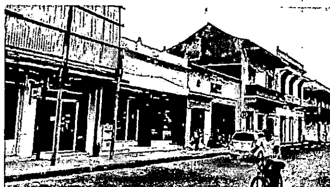
Imágenes manzana 144, comercio, oficinas, calle de la Media Luna