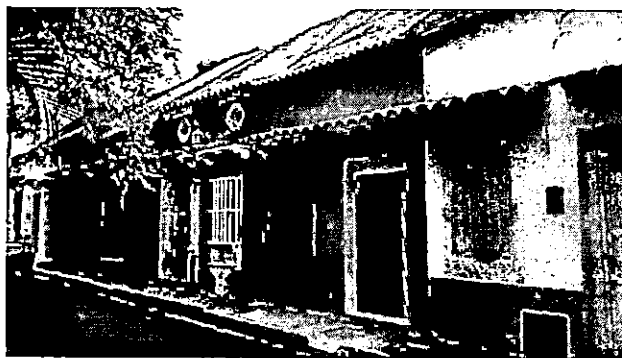
Imágenes viviendas contiguas, café del Mural, calle San Juan