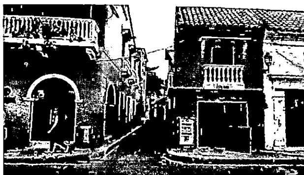
Acceso desde la calle Media Luna hacia Calle San Juan