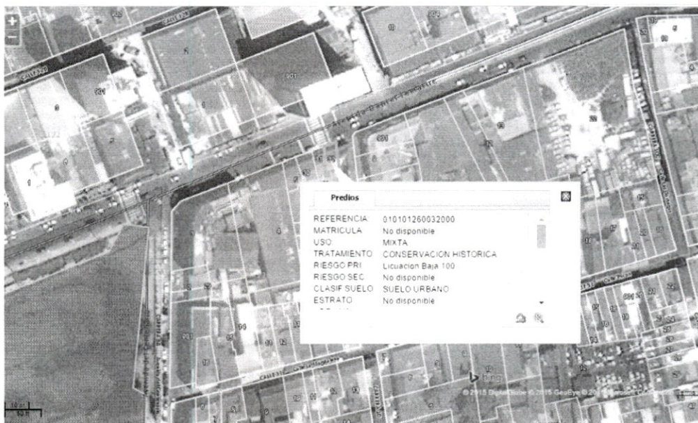
Imagen Fuente Midas Cartagena

El predio identificado con referencia catastral No. 01-01-0126-0032-000, localizado en la avenida Daniel Lemaitre o calle 32 No 9-66 en el barrio Getsemaní en el Centro Histórico de esta ciudad, de acuerdo con el artículo 522 que contiene el listado predial permite la actividad MIXTA definida en el artículo 450 de la citada disposición; en esta actividad se desarrollan las actividades RESIDENCIALES y ECONOMICAS , las cuales deben sujetarse, para su implementación en lo dispuesto en el artículo 449 de la Reglamentación Patrimonial establecida en el Decreto 0977 de 2001 o Plan de Ordenamiento Territorial. Tal como se observa en la siguiente gráfica: