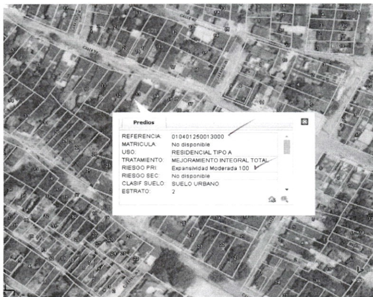
Imagen de Plano de usos de suelo PFU 5C/5- fuente POT

Para tal efecto, el Plan de Ordenamiento Territorial, en el artículo 34 definió las áreas susceptibles a expansibilidad, relacionando las áreas que presentan susceptibilidad a la expansión, relacionadas en el numeral 2 del presente artículo que se cuentan: