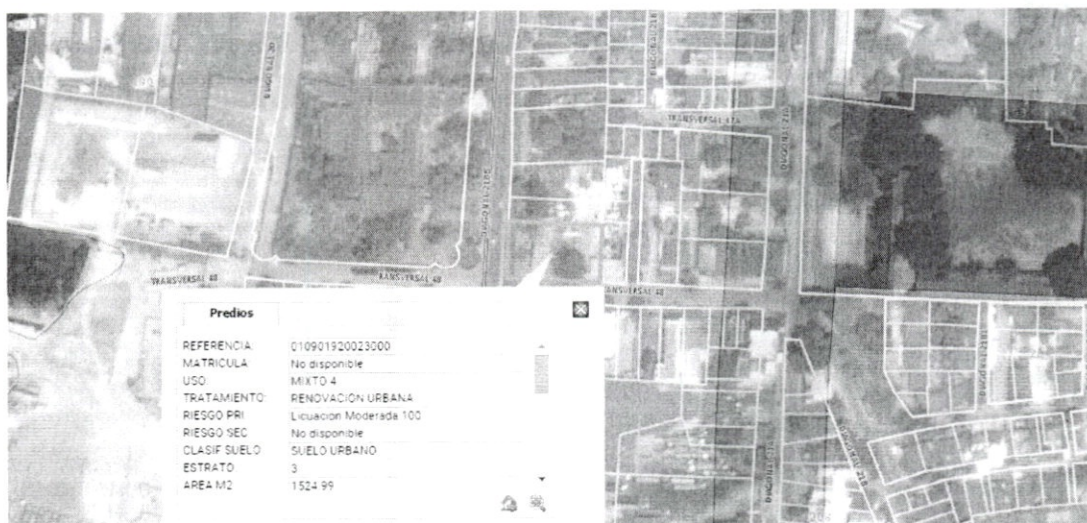
Imagen plano de usos del suelo PFU 5C/5

El predio identificado con Referencia Catastral No. 01-09-0192-0023-000 localizado en la diagonal 21 No 47-147 del barrio Bosque de esta ciudad, se encuentra dentro del área indicada y delimitada gráficamente en el plano de Uso del suelo PFU 5C/ 5, la cual hace parte integral de la cartografía oficial del POT, como actividad MIXTA 4 (M4) y se le aplicará la citada disposición. Tal como se observa en la siguiente gráfica: